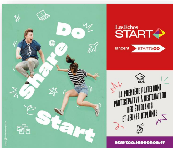
START&CO, la 1ère plateforme communautaire à destination des étudiants, jeunes actifs et entrepreneurs